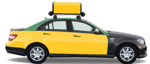
TáxiTop + Super Side