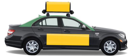
TáxiTop + Classic